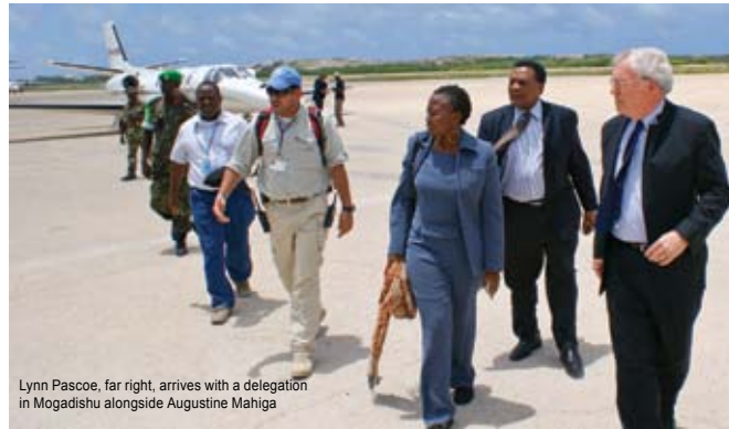
Lynn Pascoe, far right, arrives with a delegation in Mogadishu alongside Augustine Mahiga

The AMISOM police component has expanded with the addition of ten police officers from the Kenya National Police Force, making for a total team of 50 officers from Zambia, Nigeria, Ghana, Sierra Leone, Uganda and Burundi. The coming of the Kenyan Police contingent will add value to the AMISOM police component, which has the mandate to professionalize the Somali police force in order to meet international standards. The Kenyan team is led by a superintendent of police. The officers commenced their induc-