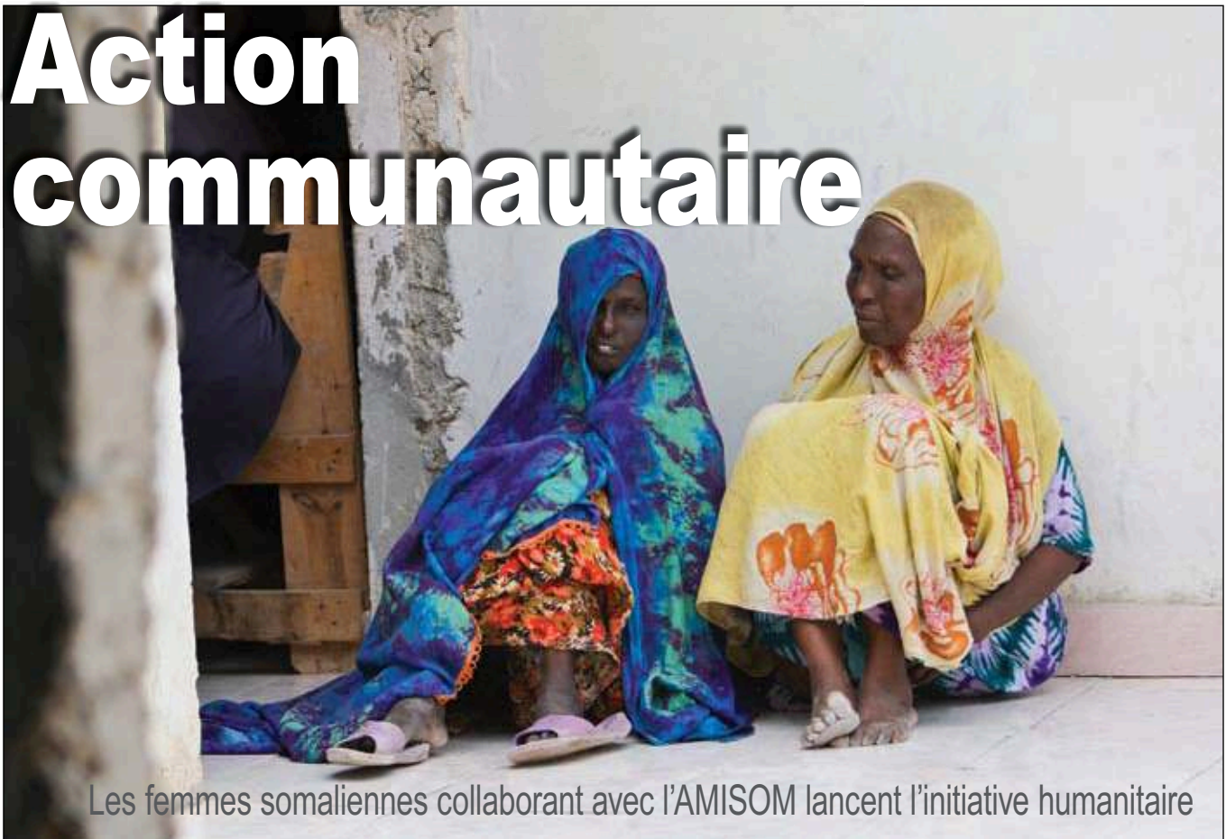
Les femmes somaliennes collaborant avec l'AMISOM lancent l'initiative humanitaire

D es douzaines de femmes somaliennes se sont réunies à la base de l'AMISOM au sud de Mogadiscio le 29 juillet afin de lancer une nouvelle initiative humanitaire appelée le Centre pour l'unification et le développement des femmes somaliennes. Une initiative financée à partir des contributions des Somaliens de la diaspora, le CUDSW lance un programme de scolarisation, de médicaments gratuits, de micro-prêts et de caisse de retraite à l'intention des femmes qui sont devenues veuves suite au conflit ou qui ont perdu des enfants au cours de la guerre.