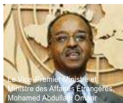
Le Vice-Premier Ministre et Ministre des Affaires Étrangères, Mohamed Abdullahi Omaar

Trois nouveaux venus compétents prennent la position de députés aux Premier Ministre. Mo-