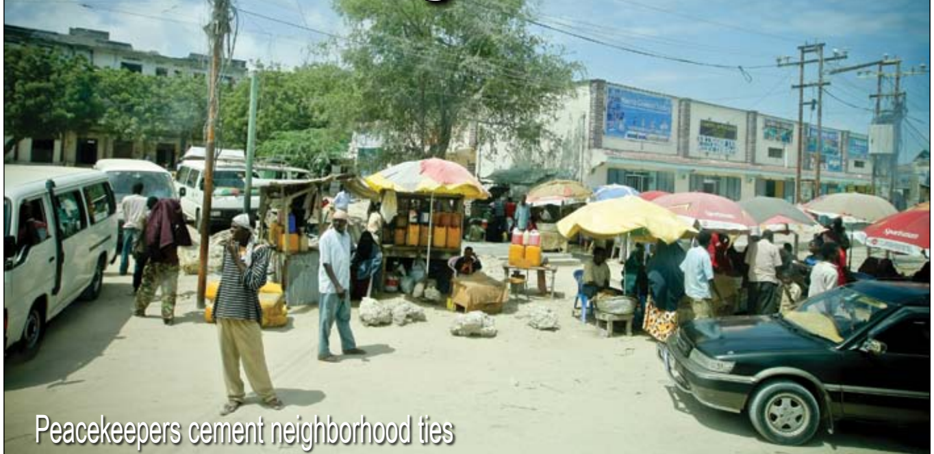
Peacekeepers cement neighborhood ties

D harkenlay district is today one of the safest districts in Mogadishu thanks largely to a close relationship between Burundian peacekeepers and the civilian population living around the AMISOM bases in southern Mogadishu. A few years ago, before the peacekeepers arrived, Dharkenlay district was just another insecure area of Mogadishu, where clan militias and militants brutalized and extorted the local population. When the Burundian peacekeepers arrived in late 2008, the insurgents welcomed them with mortar fire and roadside bombs. They even carried out a suicide attack in April of 2008 at the former National University, which acts as the main base for the Burundi contingent in Somalia. Twelve peacekeepers were killed that day in Mogadishu, and many more were wounded.