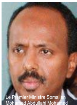
Le Premier Ministre Somalien Mohamed Abdullahi Mohamed

Le Premier Ministre Somalien Mohamed Abdullahi Mohamed a levé le voile sur son cabinet consistant de dix-huit ministres, une réduction drastique en comparaison avec le gouvernement de son prédécesseur qui contenait trente-neuf postes.