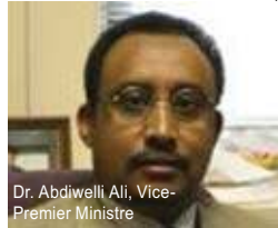
Dr. Abdiweli Ali, Vice- Premier Ministre

hamed Abdullahi Omaar, un politicien très respectable venant du Nord de la Somalie et éduqué à Oxford, sera député au Premier Ministre et Ministre des Affaires Étrangères. Abdilhakim Mohamoud Haji-Faqi, un ex-diplomate Somalien aux États-Unis et au Canada servira en tant que député au Premier Ministre et Ministre de la Défense. Abdiweli Mohamed Ali,