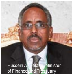
Hussein Abdi Halane, Minister of Finance and Treasury

"The Somali people and the international community were waiting for a competent and credible Somali cabinet, and I am happy to appoint this lean but capable cabinet," Mohamed said. "I call on my fellow countrymen to work with and assist these fine men and women tasked to revive the Somali state."