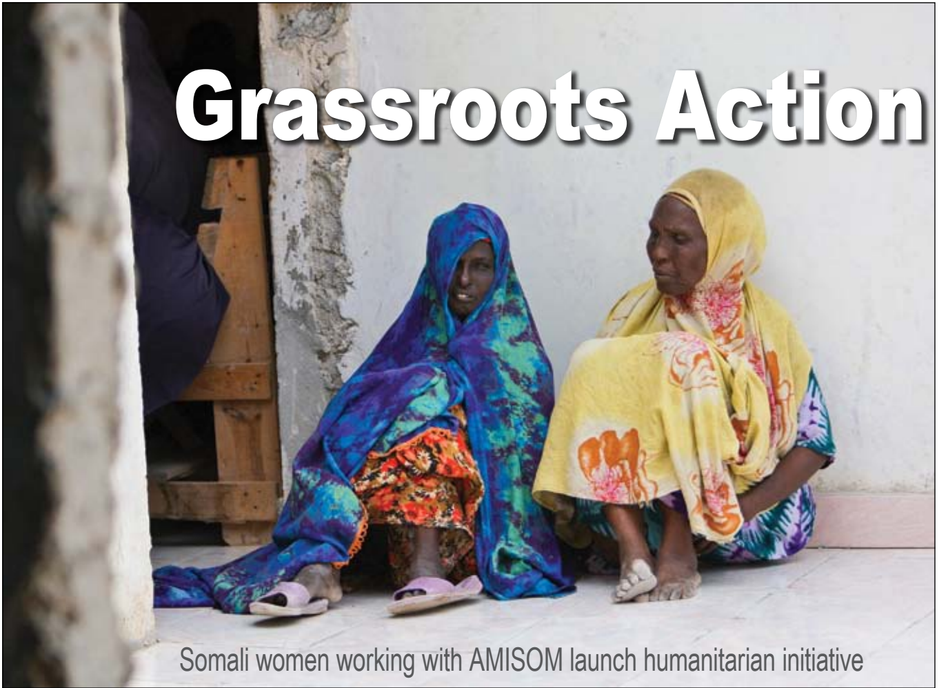
Somali women working with AMISOM launch humanitarian initiative

D ozens of Somali women gathered at the AMISOM base in southern Mogadishu July 29 in order to launch a new nationwide humanitarian initiative called the Center for Unification and Development of Somali Women. Funded by contributions from the Somali Diaspora, the CUDSW is launching a program of schooling, free medicine, micro loans and retirement facilities for those women who have been widowed by the conflict or lost children during the fighting.