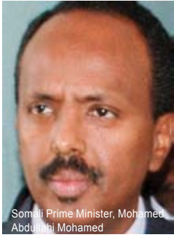
Somali Prime Minister, Mohamed Abdullahi Mohamed

New Somali prime minister unveils cabinet